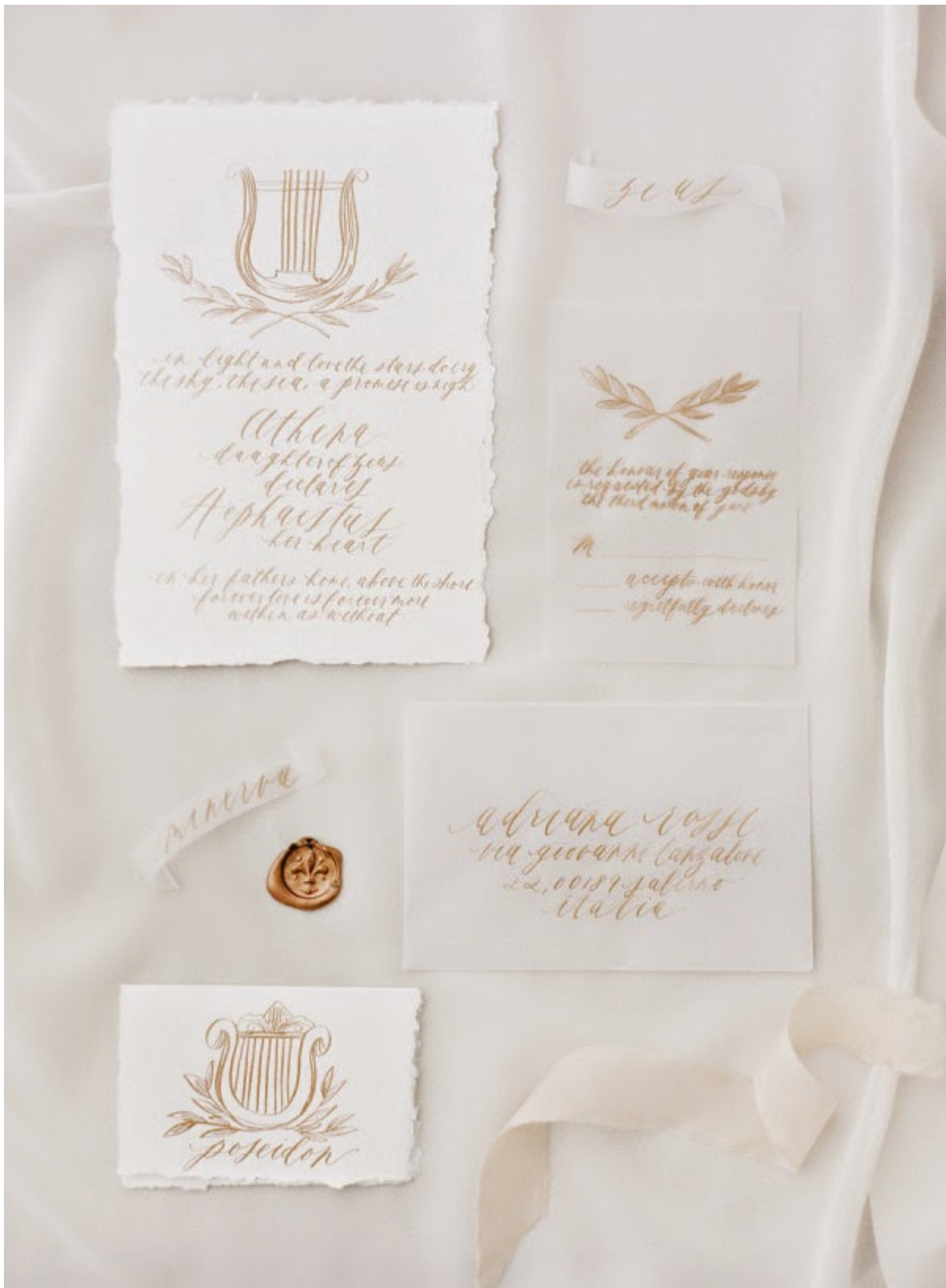
Bellissima la torta bianca e oro : Farfalla Di Zucchero xx stefania Amalfi Coast Wedding Editorial // villa cimbrone Gown : Samuelle e Headpiece : jannie baltzer // moda e arte workshop style me pretty