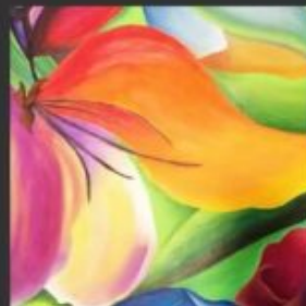
DATURA 50x60 - OLIO