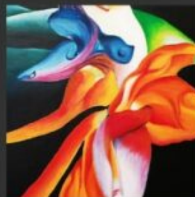
TROPICAL 2 50x70 - ACRILICO