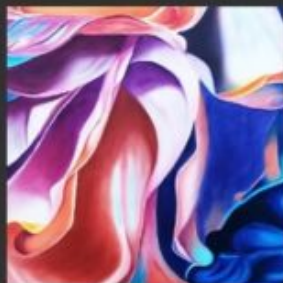
INTENSO 40x70 - OLIO