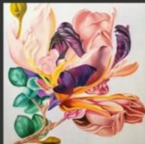
AVVOLGENTE 60x80 - OLIO

“I QUADRI DEVONO ESSERE MIRACOLOSI!” - Mark Rothko