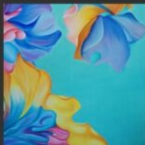
TIFFANY 50x70 - OLIO