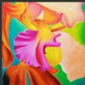
LA DANZA 50x70 - OLIO