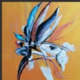
LIBERA 35x45 - ACRILICO