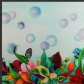
BOLLE DI LUNA 60x80 - OLIO