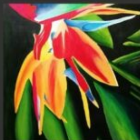
SOTTOSOPRA 40x50 - ACRILICO