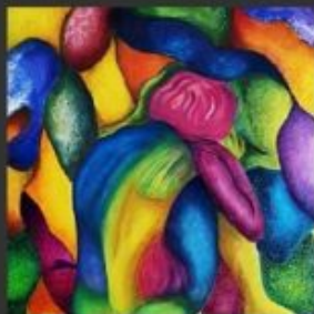
SOLA 52x71 - OLIO