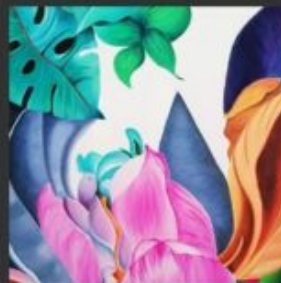
INTIMO 50x70 - OLIO