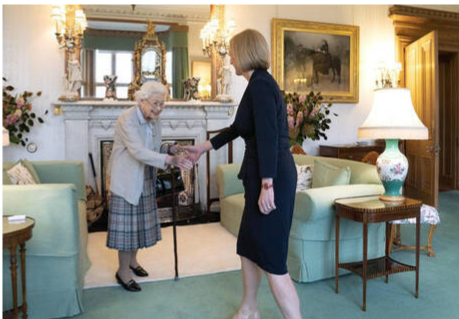
Liz Truss con la regina Elisabetta

Elisabetta II è morta, un capitolo di storia si chiude. Il Regno Unito, i Paesi dell'ex impero britannico e il mondo dicono addio in un clima di profonda commozione alla regina dei record, spirata a 96 anni nell'amata residenza scozzese di Balmoral, con attorno i quattro figli e i familiari più stretti: a cominciare dal primogenito ed erede al trono Carlo, che a 73 diventa infine re con la seconda moglie Camilla al fianco elevata a regina consorte.